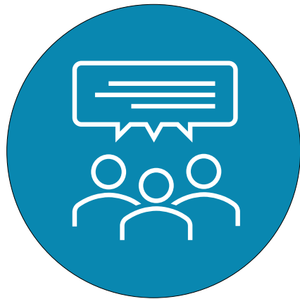
Den politiske dagsorden